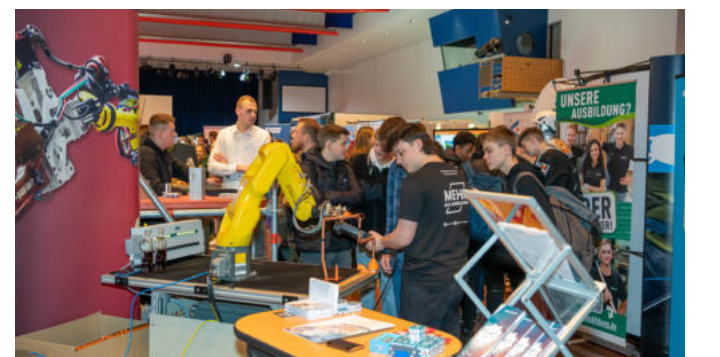
Die Resonanz bei der Berufsmesse 2023 war groß.